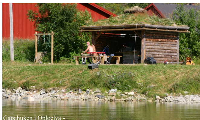
Gapahuken i Opløelva -