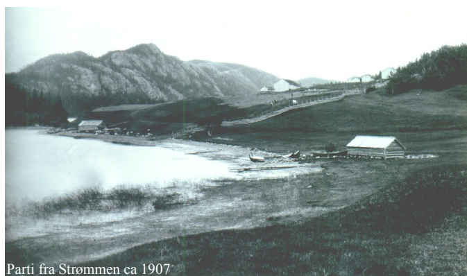
Parti fra Strømmen ca 1907

I 1966 kom det vei til Strømmen, og i motsetning til de øvrige gårdene i Salen ble folk boende frem til slutten av 1980-tallet da økt mekanisering i skogen reduserte arbeidskraftsbehovet. Strømmen har alltid hatt en sentral plassering i Salen, og har vært benyttet som utgangspunkt for gårdens eiere (Firma Albert Collett) og dets gjester i forbindelse med jakt og fiske.